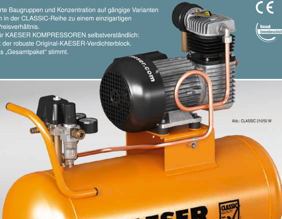
Abb.: CLASSIC 210/50 W